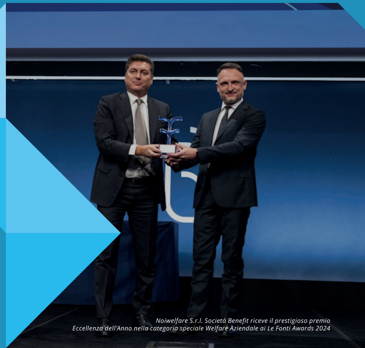
Noiwelfare S.r.l. Società Benefit riceve il prestigioso premio Eccellenza dell'Anno nella categoria speciale Welfare Aziendale ai Le Fonti Awards 2024

“ Il nostro obiettivo è diventare agenti di cambiamento positivo nella società, utilizzando il welfare aziendale come strumento per promuovere uno sviluppo equo, inclusivo e sostenibile.